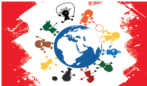
Figura 3. La escuela inclusiva misma formación y educación para todos los niños

Es necesario que abandonemos la escuela tradicionalista que poco les aporta a niños con necesidades educativas, así como al resto de los compañeros. Hay que crear el camino hacia una escuela, y de paso a una sociedad más justa y solidaria con sus integrantes: una escuela inclusiva.