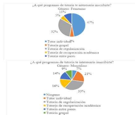
Gráfica 1. Interés por inscribirse a que Programa aun cuando no lo conocen. Elaboración propia

Relacionado al planteamiento de que programa de tutorías le interesaría inscribirse, por género femenino señalan como primera mención con el 47% la tutoría individual, con el 32% la de regularización, con el 11% entre pares, siendo estas tres las más relevantes; en relación al género masculino con el 33% la de regularización, el 21% la individual, el 16% la de recuperación académica, el 14% entre pares, lo cual muestra el interés de tener el acompañamiento de la acción tutorial, en algunas de los tipos de atención que se ofertan (Ver Grafica 1).