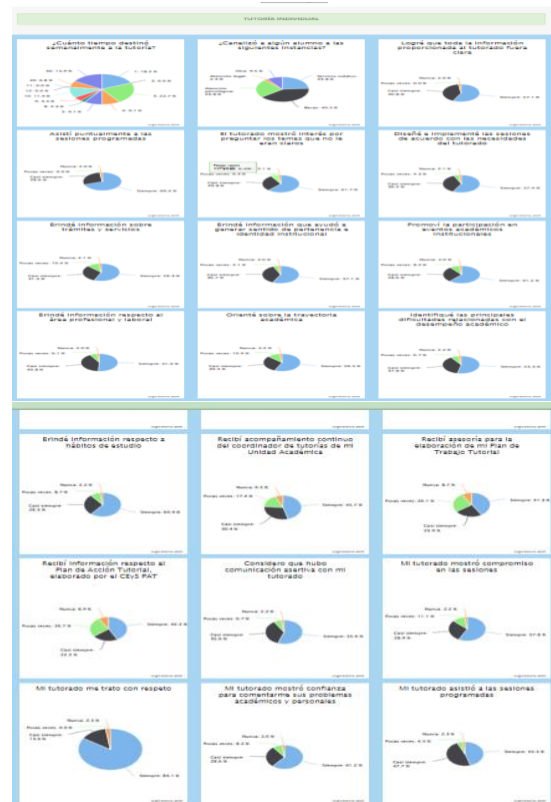
Figura 2. Captura de pantalla del resultado del SADPIT semestre 2-2023 en la autorreflexión

Los resultados del sistema SADPIT semestre 2-2023 se muestran en la figura 2