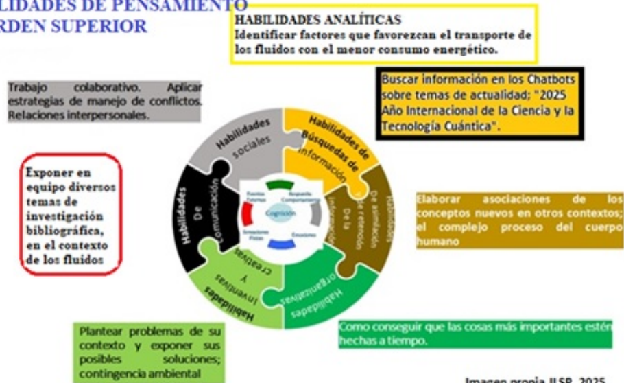
Fig. 1 Habilidades de pensamiento de orden superior a impulsar en el estudiante

inteligentes y recursos digitales avanzados. 3. Fortalecer la formación integral de los docentes, a través del diseño e implementación de acciones de formación sobre metodologías activas y tecnologías emergentes que permitan afrontar los desafíos en el aula. En esta tercera acción se enfatiza el fortalecimiento en la formación integral del docente en el marco de la implementación de metodologías activas y tecnologías emergentes, considerando la IA. El campo de acción de las tecnologías emergentes en la educación es muy vasto, se tiene a la IA,