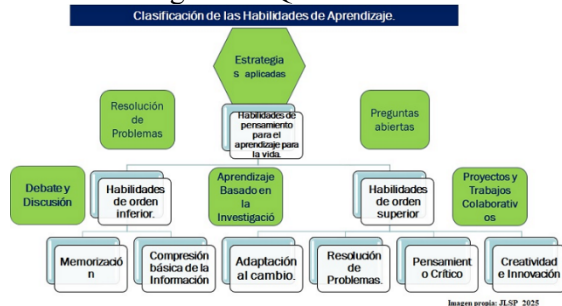
Fig. 4: Habilidades de Aprendizaje.

aprendizaje en equipo y la práctica en escenarios simulados). Por consiguiente, el facilitador del mundo actual, fig. 3, en donde se destaca ser un líder pedagógico, con sólidos conocimientos en el manejo de herramientas digitales avanzadas, ser un diseñador de experiencias educativas significativas, aplicables a contextos diversos y dinámicos, dejando el tradicional paradigma, de ser la persona poseedora del conocimiento, aplicar la analítica educativa para hacer las correcciones pertinentes y oportunas para mejorar el aprendizaje dinámico e inteligente, aplicando otras alternativas de estrategias educativas más efectivas, aunado con el manejo de la inteligencia emocional del facilitador y la de los estudiantes. En el Consenso de Beijing (2019), la UNESCO elaboró una publicación “Artificial Intelligence and Education: Guidance for Policy-makers” (Inteligencia artificial y educación, Guía para encargados de formular políticas del sector educativo, con la finalidad de crear un panorama de las oportunidades y desafíos de la IA en el ámbito de la educación, considerando competencias básicas necesarias en la era de la IA. En la figura 4 se destaca la clasificación de las habilidades de aprendizaje, es decir, de orden inferior y superior, remarcando la importancia de consolidar las de orden superior en los estudiantes que se encuentran en su formación en el nivel licenciatura para ser profesionales en las carreras de Ingeniería Química Industrial